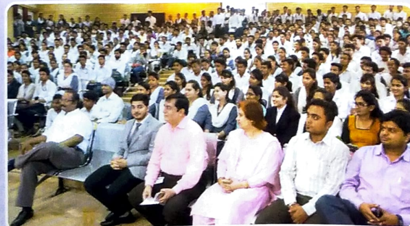
A Huge Open Campus Placement Drive was organised by Jaro Education at IPS Academy for MBA, PGDM, BCA and BCom students.