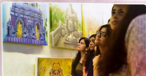
School Of Fine Arts (SOFA) had organized an exhibition on 'Ganesha-Stuti' which showcased different and divergent, renowned architectural idols (temple) of Ganesha as well as iconographical compositions of Ganesha in different styles and actions.