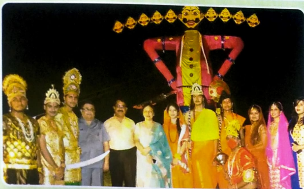
Dussehra celebration at IPSA Ground.