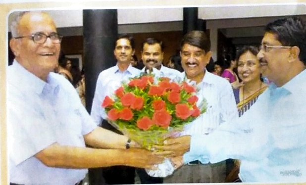
Teachers Day Celebrated on September 5th, 2017.