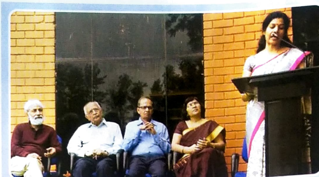
Engineers' Day was celebrated at Institute of Engineering and Science on September 15th, 2017 on the occasion of 'Bharat Ratna' Sir Mokshagundam Visvesvaraya's Birthday.